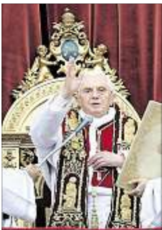
SEGEN: Benedikt XVI.

Der Termin ist längst bekannt, nur die Einzelheiten liegen im Dunkeln – Papst Benedikt XVI. wird Deutschland vom 22. bis zum 25. September 2011 besuchen. Der erste offizielle Staatsbesuch führt den Pontifex nach Berlin, Thüringen und Freiburg.